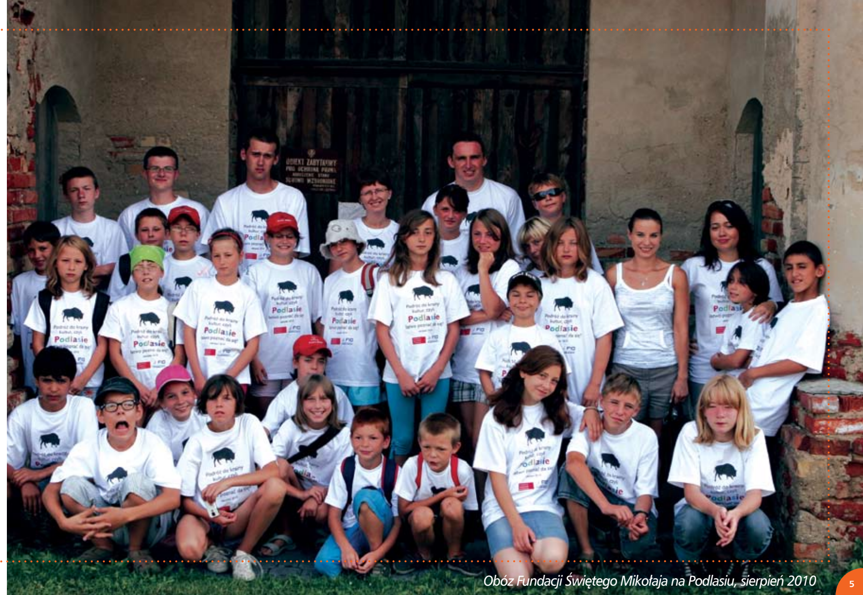
Obóz Fundacji Świętego Mikołaja na Podlasiu, sierpień 2010