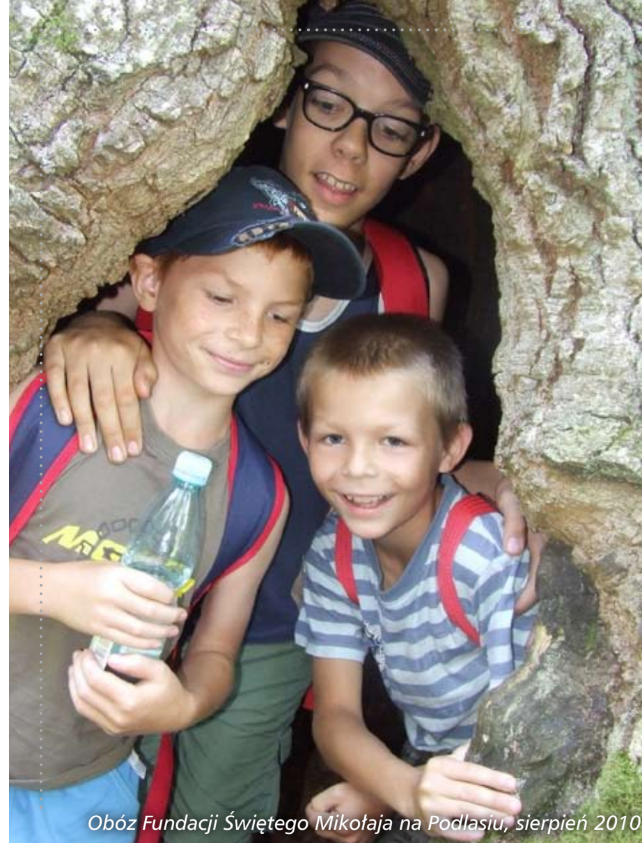
Obóz Fundacji Świętego Mikołaja na Podlasiu, sierpień 2010

Zawodowa Rodzina Zastępcza z Radomia, 2 880 zł Zawodowa Rodzina Zastępcza z Borkowa, 4 000 zł Zawodowa Rodzina Zastępcza z Lublina, 1 500 zł Zawodowa Rodzina Zastępcza z Łodzi, 2 850 zł Zawodowa Rodzina Zastępcza ze Środy Śląskiej, 1 471,68 zł Zawodowa Rodzina Zastępcza z Trzcianki, 2 219 zł Pogotowie Rodzinne z Radomia, 3 000 zł