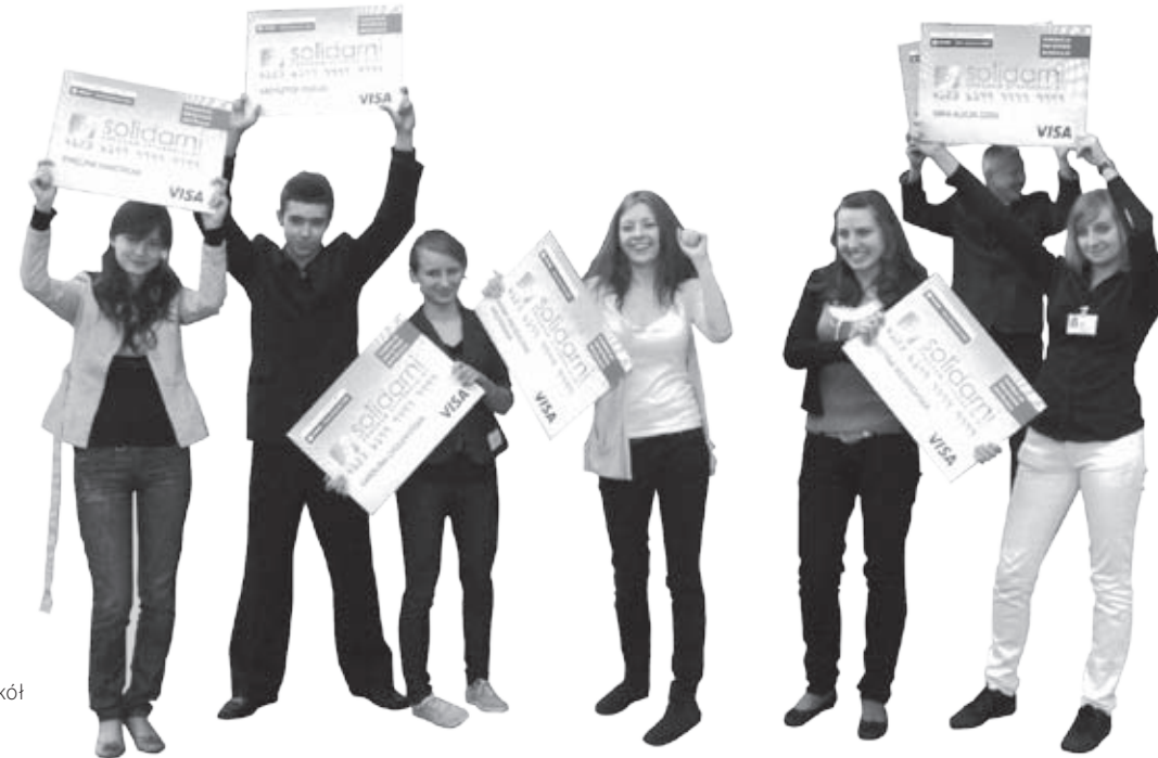
▶ stypendyści z Zespołu Szkół w Lipnie

Stypendia przekazywane są uczniom na kartach przedpłaconych (pre-paid), udostępnionych bezpłatnie przez Bank Zachodni WBK. Mieliśmy okazję odwiedzić dwie szkoły i uroczystie wręczyć stypendystom symboliczne karty.